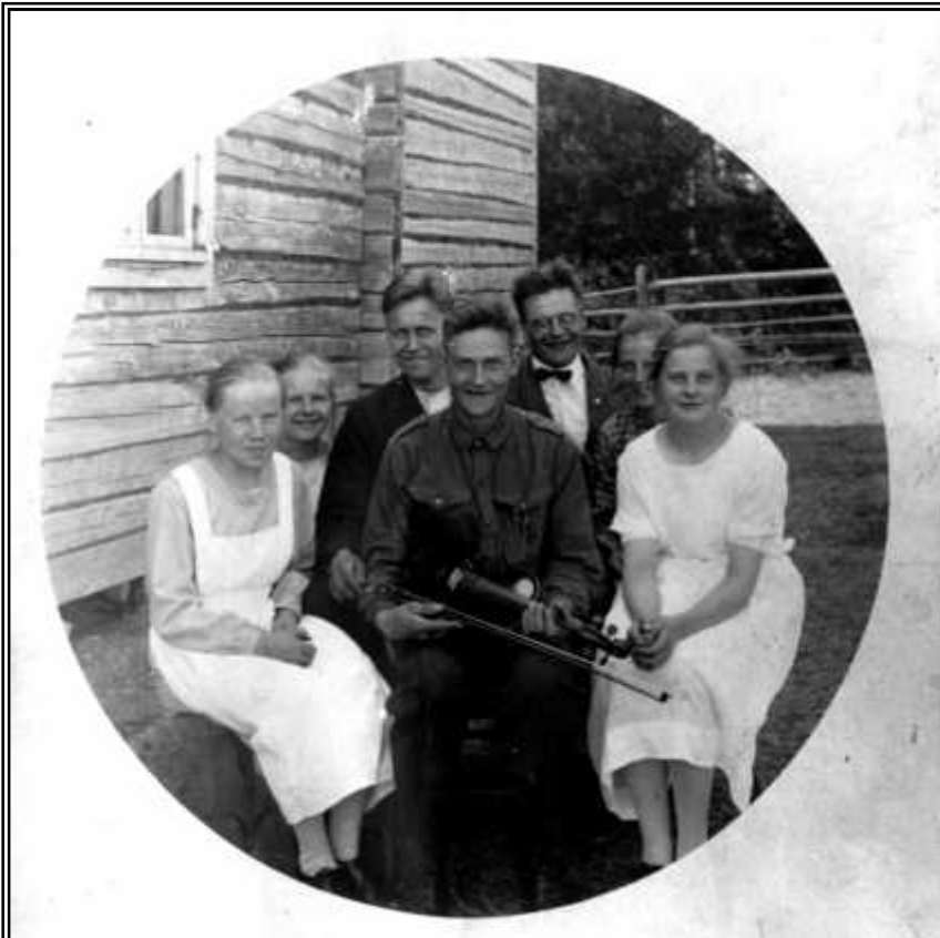
Äitienpäiväohjelman suorittajia Vaarankylän Nuorisoseurantalolla. Kuva Mäkipellon albumista.