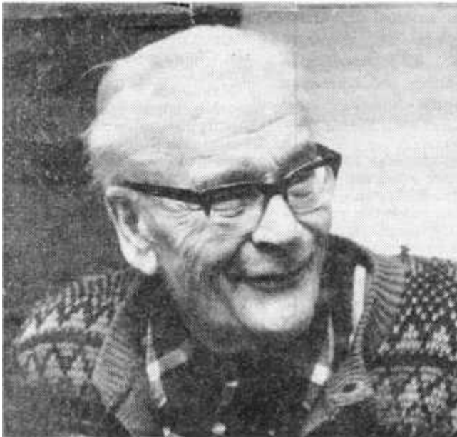
80v haastattelu Kainuun Sanomissa vuonna 1981